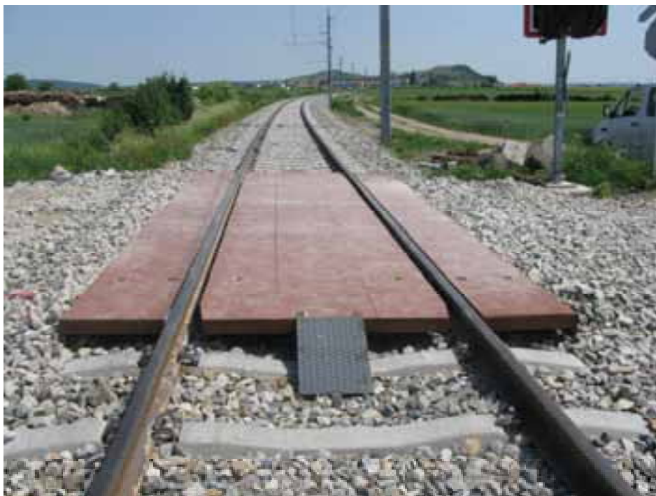
Erste eingebaute EK aus FFU Kunstholz in Europa