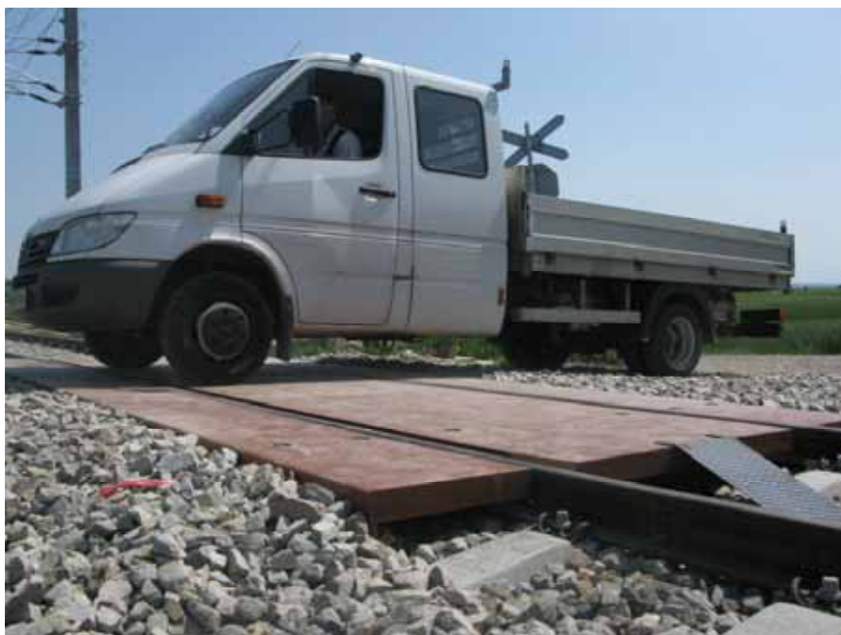
Der erste Nutzer der EK