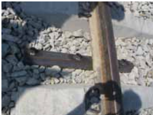
Sicherung gegen Abheben der EK