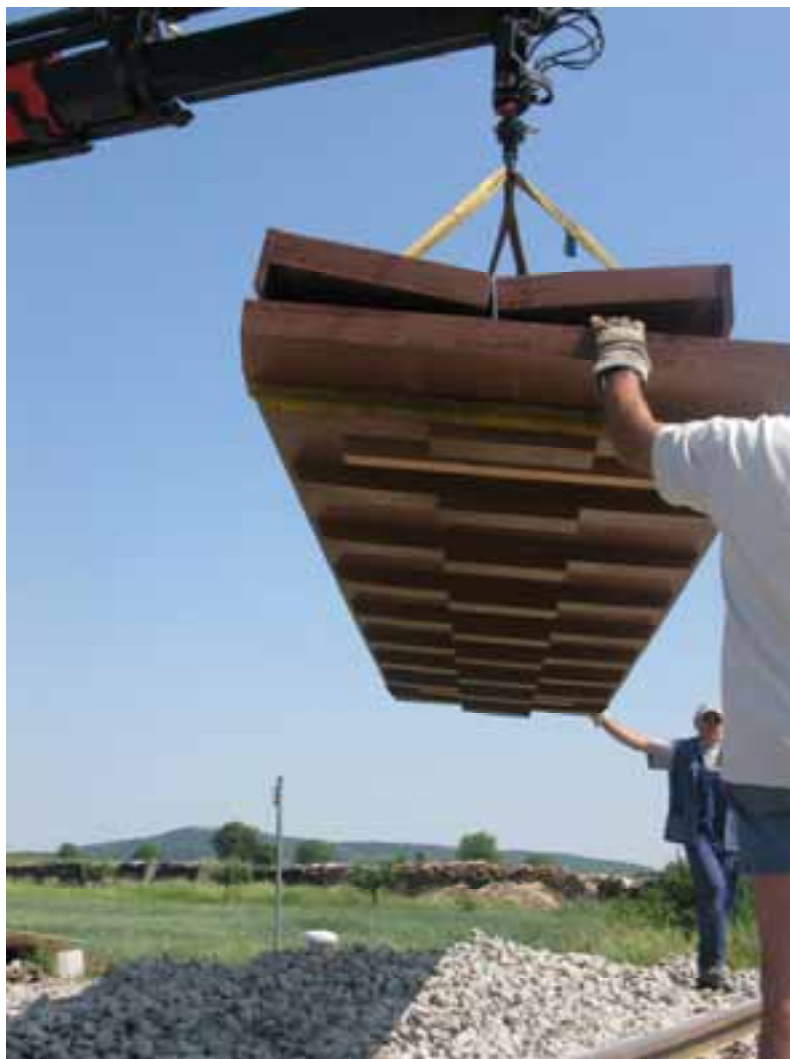
Vorgefertigte Eisenbahnkreuzung aus 3 Teilen