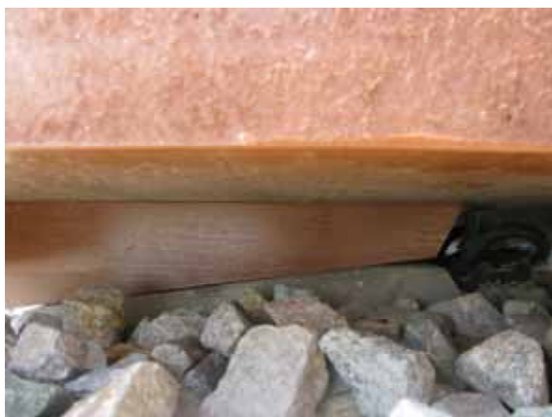
Auflagerung FFU am Ende der Betonschwellen