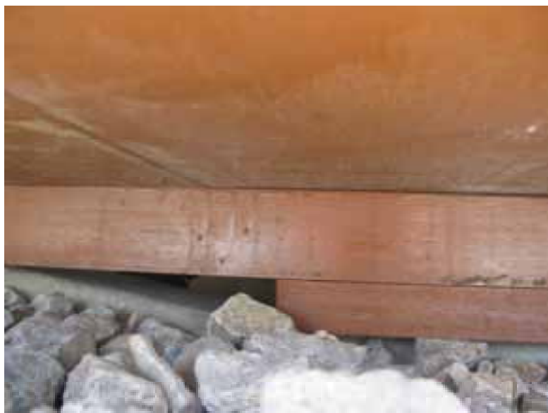
Auflagerung FFU auf Betonschwelle zwischen Schienen